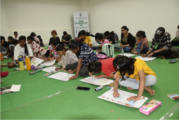
पर्यावरण दिवस के उपलक्ष्य में आयोजित प्रतियोगिता में भाग लेते स्कूली बच्चे

पर्यावरण के प्रति जागरूकता फैलाने के उद्देश्य से "प्लास्टिक प्रदूषण के समाधान" विषय पर दो सत्रों में आयोजित इस प्रतियोगिता के प्रथम सत्र में केवल सीसीएल में कार्यरत कर्मियों के लगभग 150 बच्चों ने भाग लिया। इसमें तीन आयु वर्ग – प्रेप से कक्षा 2 तक, कक्षा