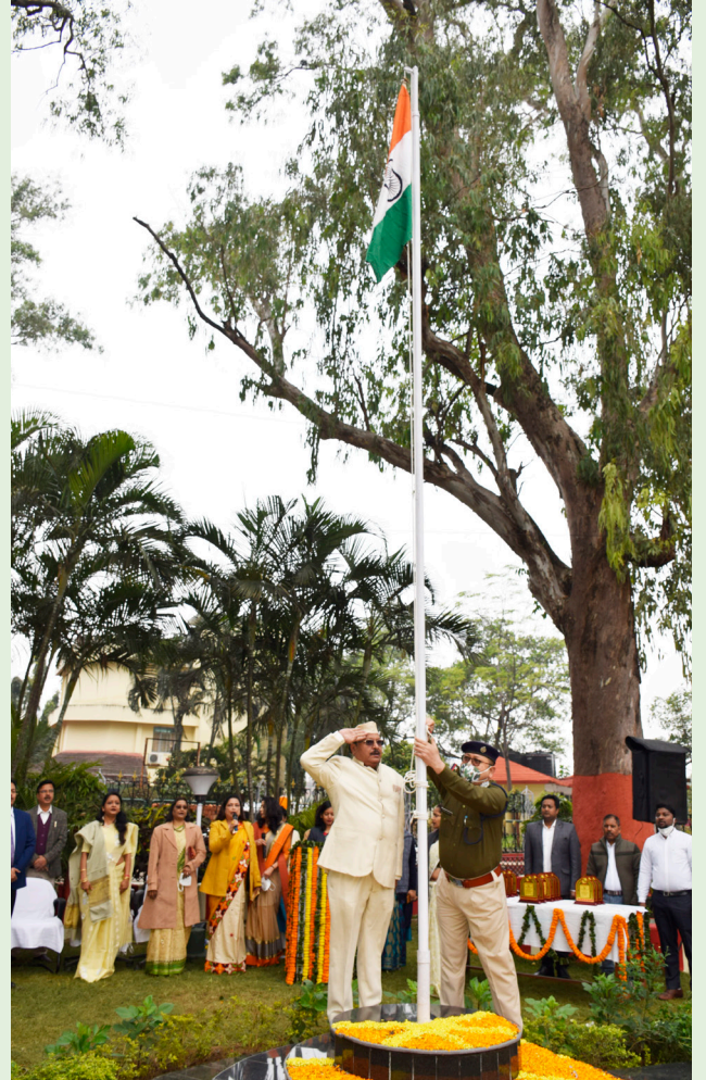
गांधीनगर अस्पताल में ध्वजारोहण समारोह के दृश्य