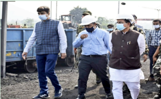
माननीय कोयला, खान मंत्री श्री प्रल्हाद जोशी अपने सीसीएल दौरा के दौरान खदान एवं रेलवे साइडिंग का निरीक्षण करते हुए

इससे पूर्व माननीय कोयला, खान मंत्री श्री प्रल्हाद जोशी ने पिपरवार क्षेत्र के अशोका ओपनकास्ट खदान एवं बचरा रेलवे साइडिंग का निरीक्षण किया। इस दौरान उन्होंने 24*7 कोयला उत्पादन में लगे कर्मियों का उत्साहवर्धन किया। उन्होंने कहा कि उन्हें पूरा विश्वास है कि हमारे कोयला योद्धा देश की उम्मीदों पर खरा उतरेंगे। विदित है कि देशभर के पावर प्लांट में कोयले की कमी की खबर के बीच माननीय कोयला मंत्री का यह दौरा अत्यंत महत्वपूर्ण था। उन्होंने न सिर्फ कर्मियों से मिले बल्कि अधिकारियों को युद्ध स्तर पर कोयला लक्ष्य को पूरा करने के लिए प्रेरित किया।