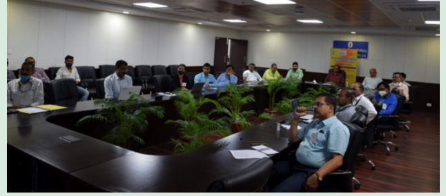
वेबिनार में उपस्थित विभिन्न गणमान्य

'सतर्कता जागरूकता सप्ताह 2021' के दौरान दिनांक 27 अक्टूबर को एक 'वेबिनार' का आयोजन किया गया। इस वेबिनार का मुख्य उद्देश्य डेलिगेशन ऑफ पावर (डीओपी) से संबंधित सभी पहलुओं पर कर्मचारियों तथा अधिकारियों को जागरूक करना था। विडीयो कॉन्फ्रेंसिंग के माध्यम से सीसीएल के सभी क्षेत्रों से कर्मियों ने भी भाग लिया।