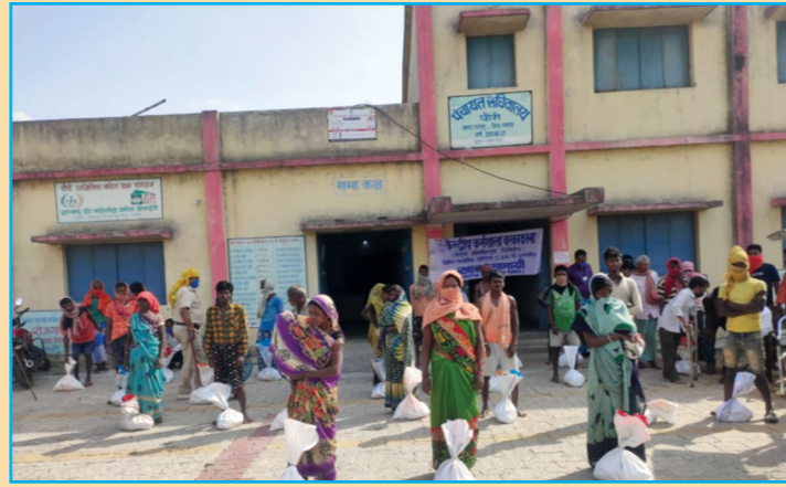
पंचायत सचिवालय, पीरी में सीआरएस, बरकाकाना की ओर से खाद्य सामग्री का वितरण

सीसीएल तालाबंदी के दौरान अपनी जिम्मेदारियों को पूरी निष्ठा और समर्पण से निभा रहा है। सीसीएल कर्मों पूरे जोश और उत्साह के साथ सतत अपना कार्यनिष्पादन कर रहे हैं। सीसीएल कमांड क्षेत्रों में निरंतर समाज के गरीब, दिहाड़ी मजदूरों एवं जरूरतमंदों के बीच सूखे राशन की आपूर्ति कर रहा है। सामुदायिक रसोई के माध्यम से हजारों लोगों को भोजन भी उपलब्ध कराया जा रहा है। बरका सयाल, अरगडा, उत्तरी कर्णपुरा, राजहरा, पिपरवार, रजरप्पा, कुजू, हजारीबाग, बोकारो