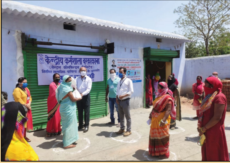
केन्द्रीय कर्मशाला, बरकाकाना में जरूरतमंदों के बीच खाने का पैकेट्स वितरण

एवं करगली, ढोरी, कथारा, मगध एवं आम्रपाली, गिरिडीह आदि क्षेत्रों में लगभग 100 किंचटल खाद्य सामग्री जैसे चावल, दाल, नमक, आटा, सरसों का तेल, सोया बरी, चूड़ा, मसाले, आलू, प्याज आदि स्थानीय प्रशासन को तालाबंदी के दौरान उपलब्ध कराया है। खाद्य सामग्री के साथ साथ मास्क, सैनिटाइज़र आदि प्रदान किया गया है। साथ ही कंपनी ने 12,000 से अधिक परिवारों के बीच खाने का पैकेट भी वितरित किया है।