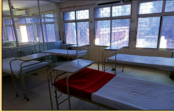
गांधीनगर अस्पताल में कोविड वार्ड

सेंट्रल कोलफील्ड्स लिमिटेड (सीसीएल) के सभी केंद्रीय अस्पताल, झारखंड के कोरोना संक्रमित से सम्बंधित मामलों से निपटने के लिए तैयार हैं। सीसीएल कोविड-19 की बढ़ती महामारी से उत्पन्न चुनौती और खतरे का सामना करने के लिए सभी आवश्यक कदम उठा रहा है और यह सुनिश्चित कर रहा है कि "कोरोना वारियर्स" किसी भी परिस्थिति का सामना करने के लिए तैयार रहें।