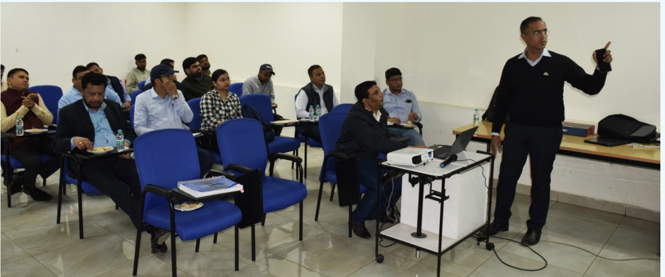
कार्यशाला का एक दृश्य

इस कार्यक्रम को सफल बनाने में सामग्री प्रबंधन विभाग के अधिकारियों एवं कर्मचारियों का महत्वपूर्ण योगदान रहा।