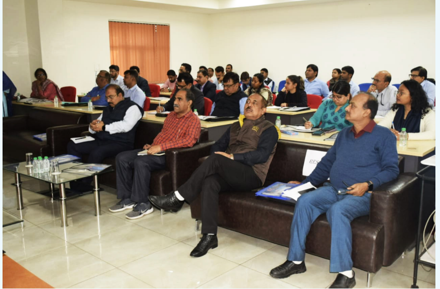
कार्यशाला का एक दृश्य