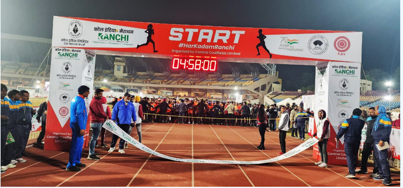
ऐतिहासिक 'द्वितीय कोल इंडिया मैराथन' शुरुआत का एक दृश्य

दिनांक 11 फरवरी, 2024 को बिरसा मुण्डा स्टेडियम, मोरहाबादी, राँची में कोल इंडिया लिमिटेड के तत्वावधान में सीसीएल द्वारा आयोजित अविस्मरणीय एवं ऐतिहासिक 'द्वितीय कोल इंडिया मैराथन' सफलतापूर्वक संपन्न हुआ। इस मैराथन में झारखंड राज्य सहित देश भर से 7500 धावकों से अधिक ने हिस्सा लिया। कोल इंडिया लिमिटेड के तत्वावधान में सेंट्रल कोलफील्ड्स लिमिटेड द्वारा 11 फरवरी 2024 को आयोजित यह कोल इंडिया मैराथन का दूसरा संस्करण बेहद सफल रहा। चार श्रेणियों में आयोजित यह मेगा इवेंट (फुल मैराथन – 42.19 किमी, हाफ मैराथन – 21 किमी, 10 किमी दौड़ और 5 किमी) एआईएमएस (AIMS) से आधिकारिक रूप से पंजीकृत मैराथन था। इस प्रतियोगिता में महिला और पुरुष धावकों के लिए अलग-अलग श्रेणियाँ थीं।