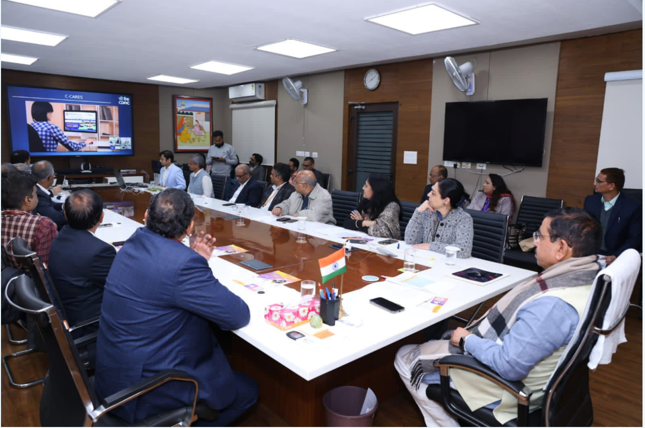
सीएमपीएफओ का केंद्रीकृत दावा प्रसंस्करण और निपटान पोर्टल का उद्घाटन करते माननीय कोयला और संसदीय कार्य मंत्री श्री प्रल्हाद जोशी

दिनांक 01 फरवरी को माननीय कोयला और संसदीय कार्य मंत्री श्री प्रल्हाद जोशी ने कोयला खदान भविष्य निधि संगठन (सीएमपीएफओ) का केंद्रीकृत दावा प्रसंस्करण और निपटान पोर्टल (Centralized Claim Processing and Settlement Portal) लॉन्च किया। इस पोर्टल के माध्यम से कर्मचारियों के भविष्य निधि से सम्बंधित किसी भी दावे का त्वरित निपटारा पूरी पारदर्शिता के साथ होगा। इतना ही नहीं इस पोर्टल में सभी प्रकार की सूचनाएँ संरक्षित एवं उपलब्ध रहेगी। यह मैन्युअल रूप से भविष्य निधि का दावों के निपटारा करने की वर्तमान प्रक्रिया को प्रतिस्थापित करेगा। सी-डीएससी इंडिया द्वारा विकसित यह वेब पोर्टल 3.5 लाख सीएमपीएफ ग्राहकों की आवश्यकताओं को पूरा करेगा और 6 लाख से अधिक पेंशनरों को इसका लाभ होगा।