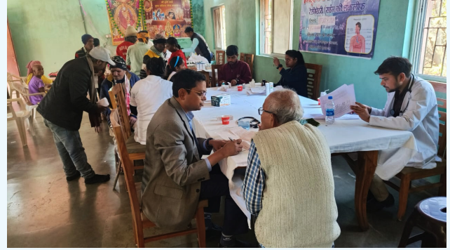
पिस्का नगड़ी स्थित आदर्श वृद्धाश्रम में आयोजित निःशुल्क स्वास्थ्य सेवा शिविर में मरीजों का जाँच करते सीसीएल के चिकित्सक

विगत 02 फरवरी को सीसीएल जन आरोग्य केंद्र द्वारा राँची के सुतियाम्बे बस्ती में निःशुल्क स्वास्थ्य सेवा शिविर का आयोजन किया गया। इस शिविर में 207 ग्रामीणों की एनेमिया की जाँच की गयी। इस शिविर में एनेमिया, उच्च रक्तचाप एवं मधुमेह के मरीजों की स्वास्थ्य जाँच कर उन्हें चिकित्सीय परामर्श देते हुए निःशुल्क दवाई भी प्रदान की गयी। बताते चलें कि सीसीएल अपने हितधारकों सहित कमान क्षेत्र के आस-पास रहने वाले सभी लोगों का विशेषकर गरीब और ग्रामीणों के स्वास्थ्य के प्रति जन सेवा के लिए कृतसंकल्पित है।