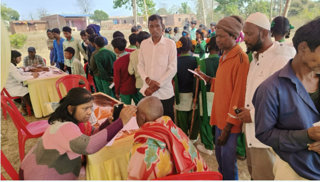
जन आरोग्य केंद्र, सीसीएल द्वारा आयोजित सुतियाम्बे बस्ती में निःशुल्क स्वास्थ्य शिविर का एक दृश्य

विगत 02 फरवरी को सीसीएल जन आरोग्य केंद्र द्वारा राँची के सुतियाम्बे बस्ती में निःशुल्क स्वास्थ्य सेवा शिविर का आयोजन किया गया। इस शिविर में 207 ग्रामीणों की एनेमिया की जाँच की गयी। इस शिविर में एनेमिया, उच्च रक्तचाप एवं मधुमेह के मरीजों की स्वास्थ्य जाँच कर उन्हें चिकित्सीय परामर्श देते हुए निःशुल्क दवाई भी प्रदान की गयी। बताते चलें कि सीसीएल अपने हितधारकों सहित कमान क्षेत्र के आस-पास रहने वाले सभी लोगों का विशेषकर गरीब और ग्रामीणों के स्वास्थ्य के प्रति जन सेवा के लिए कृतसंकल्पित है।