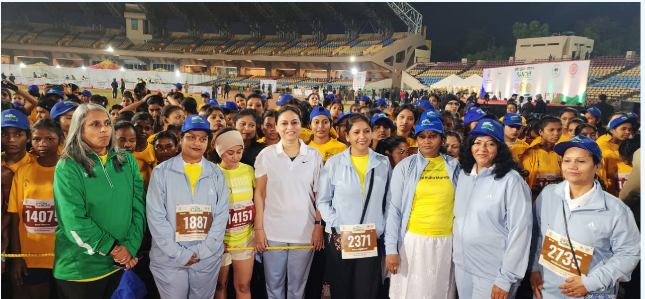
मैराथन के दौरान उपस्थित नारीशक्ति

सीएमडी, सीसीएल डॉ बी वीरा रेड्डी ने धावकों की सहभागिता के लिए उन्हें धन्यवाद दिया। उन्होंने कहा कि सीसीएल अपने हितधारकों के सर्वांगीण विकास के लिए कृत संकल्पित है। इसी कड़ी