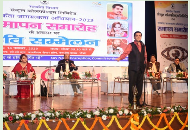
समापन समारोह में आयोजित कवि सम्मेलन की एक झलक

इस अवसर पर सीसीएल मुख्यालय एवं क्षेत्रों के कर्मों सहित नगर के हिंदी प्रेमियों इस कवि सम्मेलन का आनन्द उठाया तथा श्रोताओं के ठहाकों तथा तालियों से पूरा सभागार गूँजता रहा।