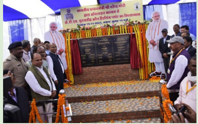
केडीएच-पुरनाडीह का वर्चुअल शिलान्यास का एक दृश्य

ज्ञात हो कि भारत सरकार के 'पीएम गतिशक्ति मास्टर प्लान' के सिद्धांत को सीसीएल में समाहित करते हुए कोयला परिवहन में मेकेनाइज्ड फर्स्ट माइल कनेक्टिविटी की अवधारणा को मूर्त रूप दिया जा रहा है। फर्स्ट माइल रेल कनेक्टिविटी की दिशा में केडीएच-पुरनाडीह कोल हैंडलिंग प्लांट एक महत्वपूर्ण कड़ी साबित होगा जिसके तहत सीसीएल के केडीएच तथा पुरनाडीह कोयला खदानों से उत्पादित कोयले को निकटतम रेलवे सर्किट तक ले जाने की व्यवस्था की जायेगी, जहाँ से इसे देश भर के ताप विद्युत संयंत्रों तथा अन्य उपभोक्ताओं तक