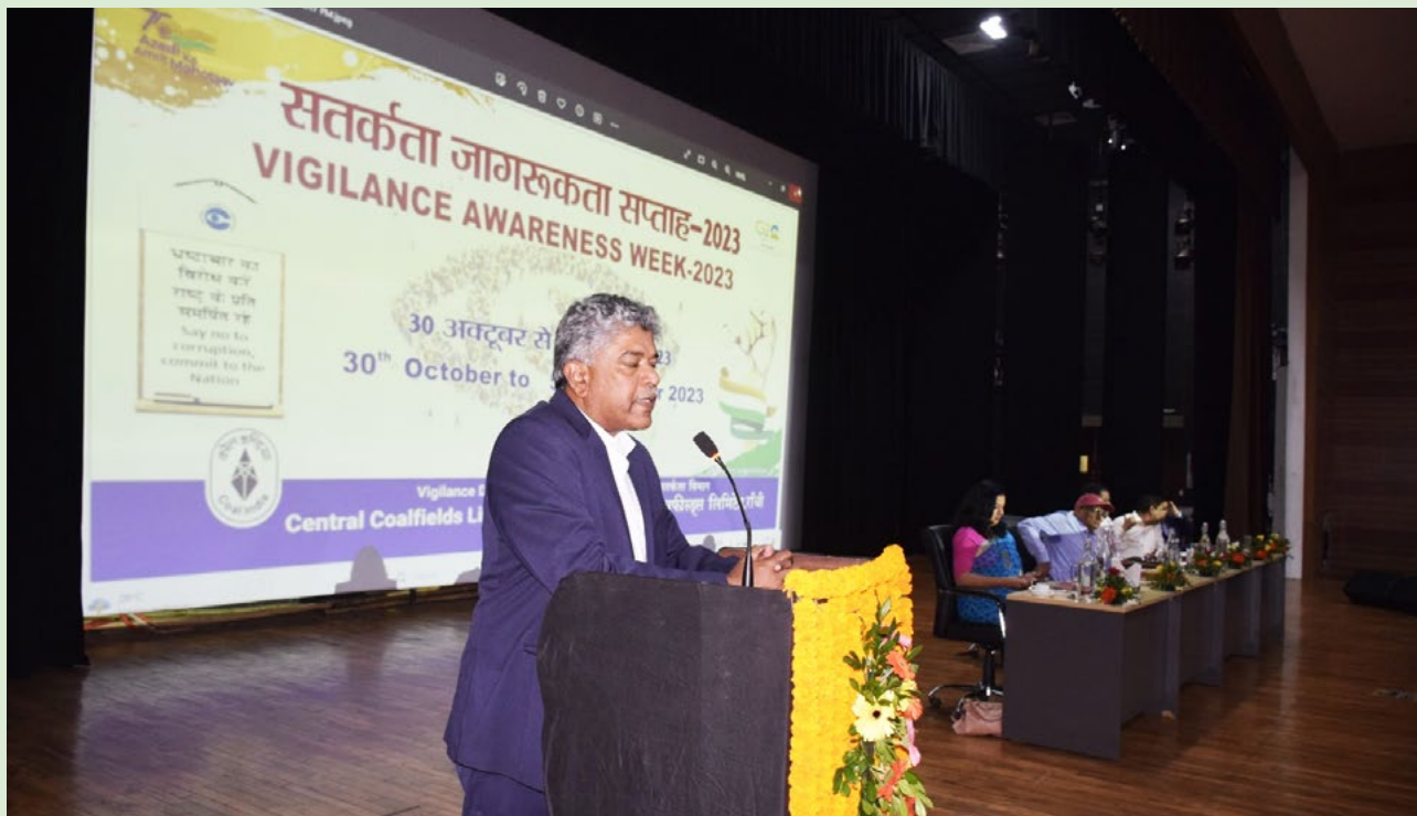
'सतर्कता जागरूकता अभियान 2023' का समापन-सह-पुरस्कार वितरण समारोह को सम्बोधित करते सीएमडी, सीसीएल डॉ. बी. वीरा रेड्डी

समापन समारोह के अंतर्गत कवि सम्मेलन आयोजित