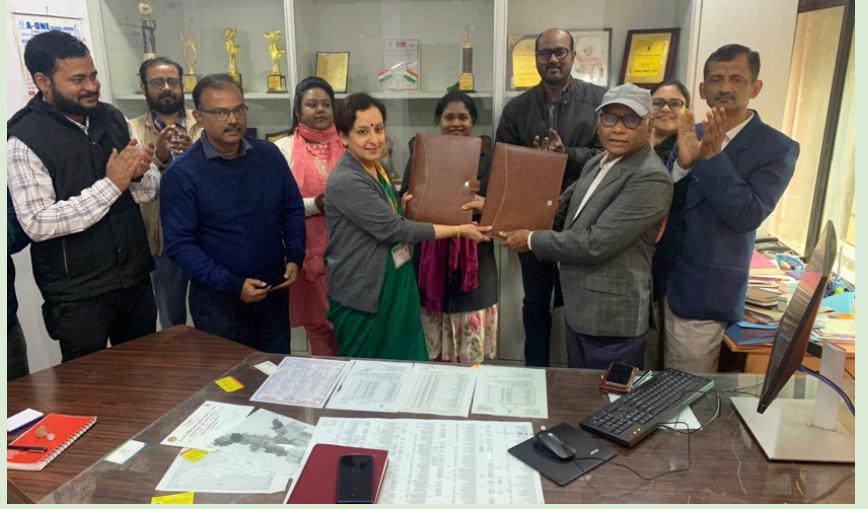
समझौता ज्ञापन का एक दृश्य

दिनांक 02 जनवरी को टीबी उन्मूलन की दिशा में सेंट्रल कोलफील्ड्स लिमिटेड (सीसीएल) ने सीएसआर पहल के अंतर्गत रोगियों को पोषण संबंधी सहायता प्रदान करने के लिए चाइल्ड इन नीड इंस्टीट्यूट (सिनी) के साथ समझौता ज्ञापन पर हस्ताक्षर किया। सीसीएल इस समझौता ज्ञापन के माध्यम से झारखण्ड राज्य के चतरा एवं लातेहार जिला में चिन्हित तपेदिक (टीबी) रोगियों को उनके घर तक मासिक पोषण बास्केट के साथ साथ मनोवैज्ञानिक संबल प्रदान करेगी।