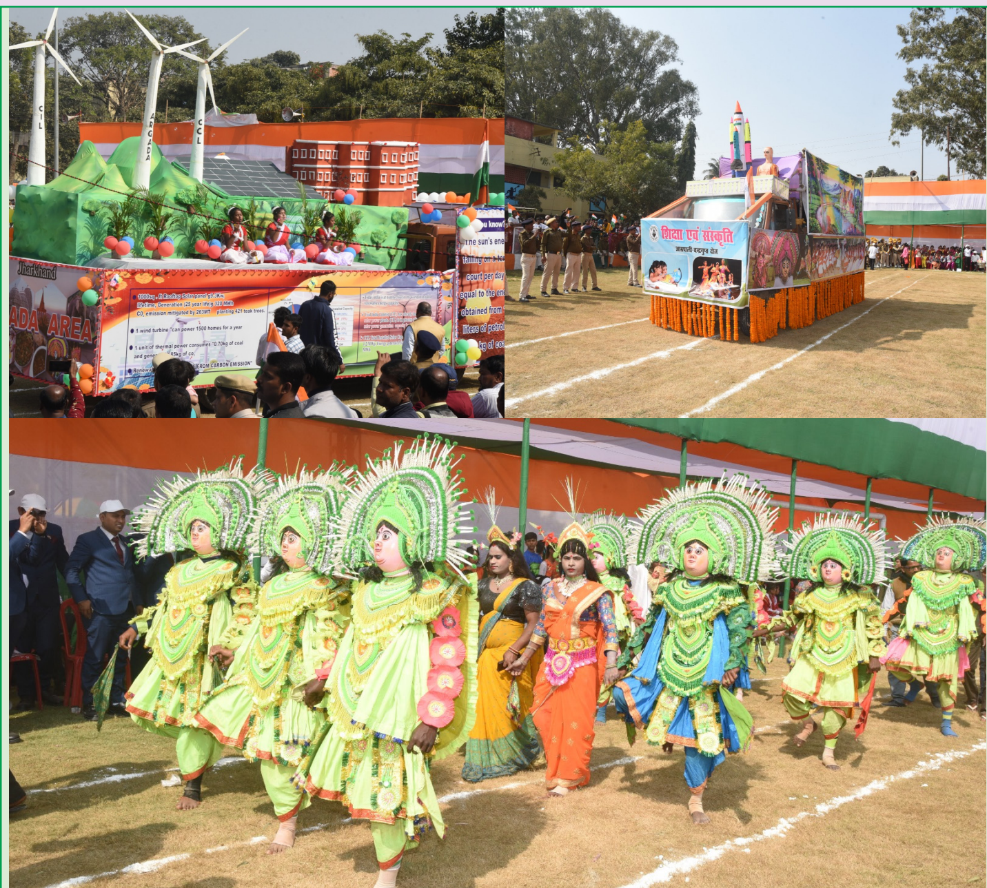
गणतंत्र दिवस के शुभ अवसर पर सीसीएल के विभिन्न क्षेत्रों द्वारा प्रस्तुत झाँकियों की एक झलक

से 5000 सीट वाले अत्याधुनिक स्टेड लाइब्रेरी का निर्माण किया जायेगा। सीसीएल द्वारा हितधारकों के समावेशी विकास के लिए विभिन्न कल्याणकारी योजनाओं का सफलतापूर्वक संचालन किया जा रहा है जिनमें 'सीसीएल के लाल एवं लाडली' एवं जेएसएसपीएस प्रमुख है।