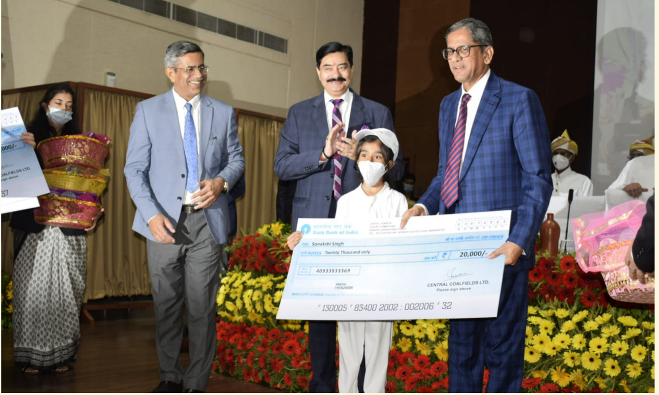
“सीसीएल कोविड क्राइसिस स्कॉलरशिप स्कीम” के एक लाभार्थी को चेक प्रदान करते माननीय मुख्य न्यायाधीश श्री एन वी रमणा

सीसीएल चयनित उम्मीदवारों को लगातार दो साल तक छात्रवृत्ति प्रदान करेगा