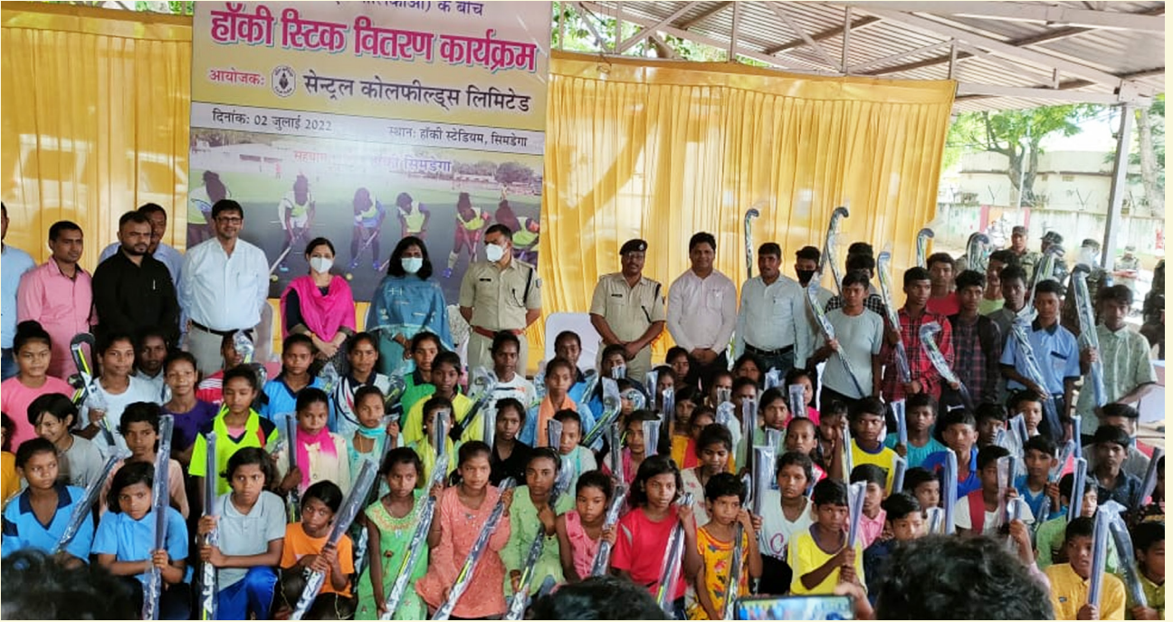
ग्रामीण क्षेत्रों के 100 प्रतिभावान हॉकी खिलाड़ियों के बीच हॉकी स्टिक वितरण का एक दृश्य

विगत 02 जुलाई को सीसीएल के द्वारा हॉकी सिमडेगा के सहयोग से सिमडेगा जिला के सुदूरवर्ती ग्रामीण क्षेत्रों के 100 प्रतिभावान हॉकी खिलाड़ियों के बीच हॉकी स्टिक का वितरण किया गया। कार्यक्रम का आयोजन एस्टोटर्फ स्टेडियम, सिमडेगा जिला में किया गया।