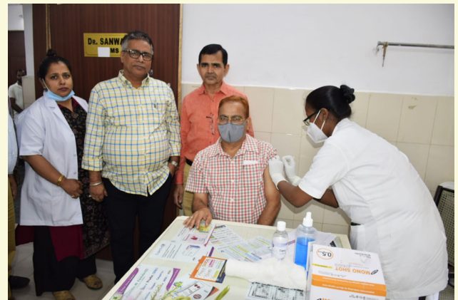
वैक्सीनेशन कैम्प का एक दृश्य