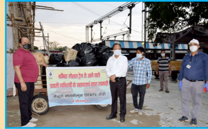
फूड पैकेट के साथ सीसीएल कर्मी

कोरोना वायरस से उत्पन्न वैश्विक महामारी और देश में घोषित लॉकडाउन में पूरा देश एक साथ खड़ा है। सेन्ट्रल कोलफील्ड्स लिमिटेड (सीसीएल) भी इस दौरान अपने कर्तव्यों का पूरी संवेदनशीलता, सजगता और समर्पण के भाव से निर्वहन कर रहा है। इसी कड़ी में विगत 01 जून को सीसीएल ने स्पेशल श्रमिक ट्रेन से यात्रा कर रहे प्रवासी मजदूरों, छात्रों और अन्य लोगों के बीच फूडपैकेट एवं पानी का बोतल वितरण किया। 'श्रमिक स्पेशल ट्रेन' उदयपुर (त्रिपुरा) से हटिया स्टेशन होते हुये लोहरदगा (झारखंड) को जा रही थी, जिसमें लगभग 1200 फूड पैकेट और पानी बोतल का वितरण किया गया।