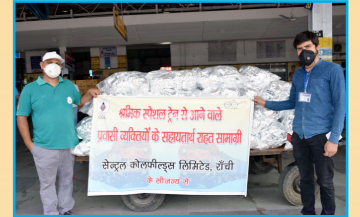
खाद्य सामग्री के साथ सीसीएल कर्मी

बेलोनिया (त्रिपुरा) से राँची स्टेशन होते हुये लोहरदगा (झारखंड) जा रही थी, जिसमें लगभग 1600 फूड पैकेट और 1600 पानी बोतल का वितरण किया गया। दूसरा 'श्रमिक स्पेशल' ट्रेन बेंगलूरु से झारखंड के बरकाकाना (रामगढ़) रेलवे स्टेशन आ रही थी। सीसीएल के बरका-सयाल एरिया ने 1750 खाने के पैकेट और पानी के बोतल बरकाकाना रेलवे स्टेशन के प्रबंधक को सौंपा। रेलवे के माध्यम से राँची एवं बरकाकाना रेलवे स्टेशन में खाने के पैकेट और पानी के बोतल प्रवासी मजदूरों सहित बच्चों एवं परिवार के सदस्य के बीच वितरण किया गया।