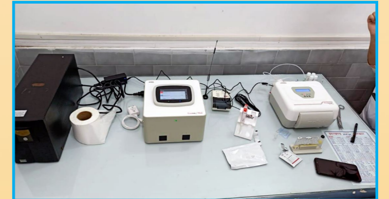
केन्द्रीय अस्पताल, गांधीनगर में स्थापित TruNat मशीन

TruNat मशीन की विशेषता है कि ये अत्यधिक आधुनिक मशीन है और संक्रमण का जाँच का परिणाम लगभग एक घंटे में आ जाता है। मशीन की क्षमता है कि प्रतिदिन 20 से 30 व्यक्ति का जाँच किया जा सकता है।