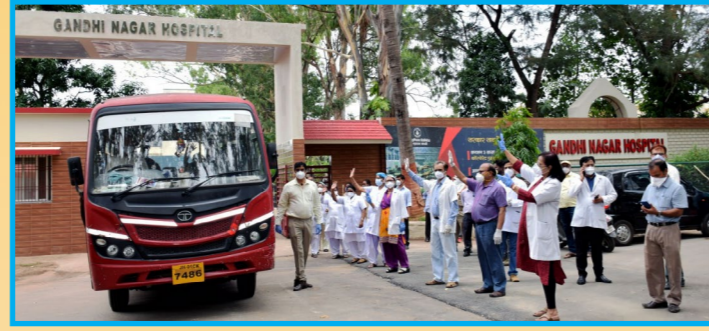
संक्रमित कोरोना मरीज स्वस्थ होकर घर वापस जाते हुए

सभी स्वस्थ मरीज काफी खुश थे और वे सीसीएल प्रबंधन एवं उनकी देखरेख करने वाले चिकित्सकों, पारा मेडिकल कर्मियों, सफाई कर्मियों और अन्य सभी की भूरि-भूरि प्रशंसा की और सीसीएल के प्रति आभार व्यक्त किया। गांधीनगर अस्पताल में वर्तमान में शत-प्रतिशत मरीज स्वस्थ होकर अपने-अपने घर चले गये हैं।